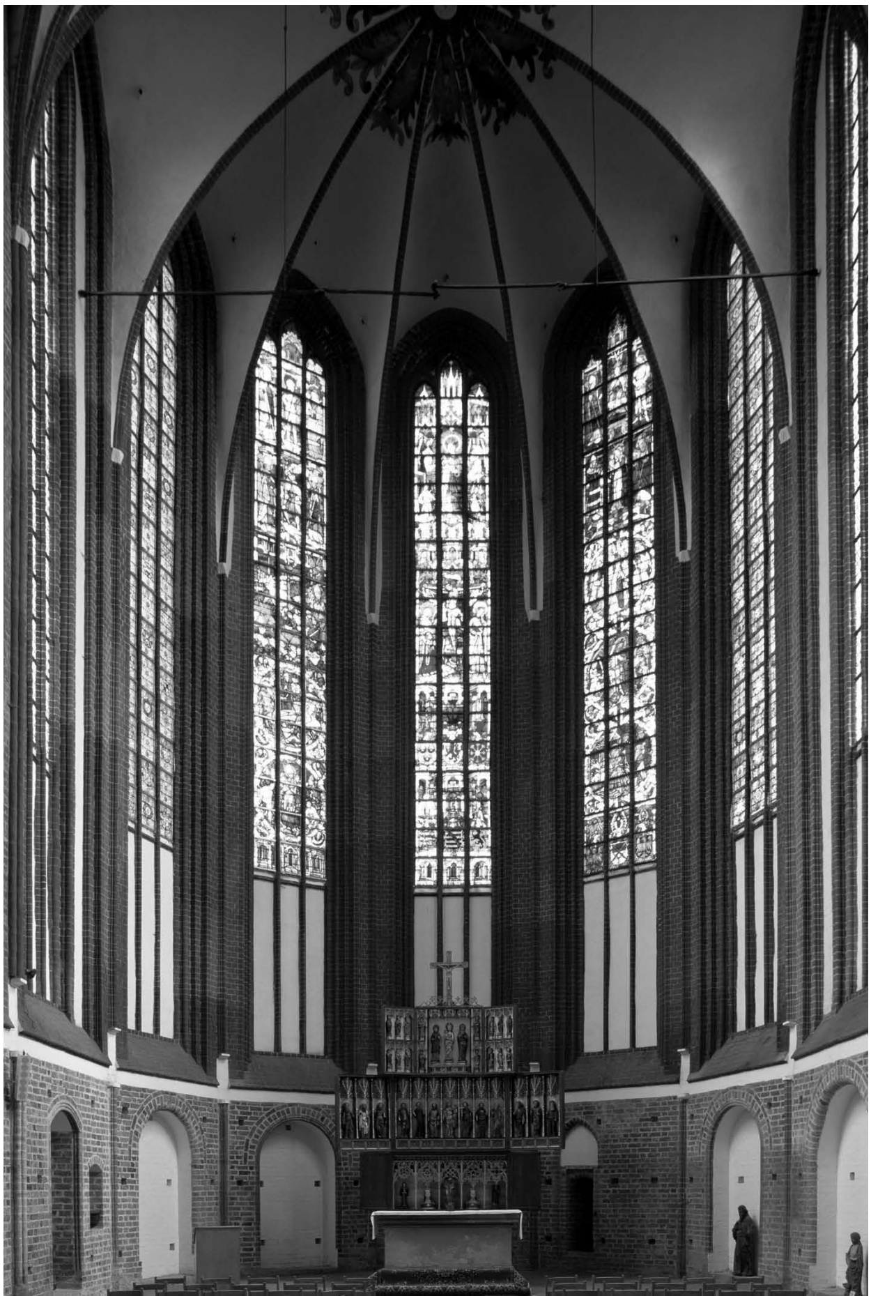
פנים כנסיית וילסנק (Wilsnack) בצפון גרמניה בימינו