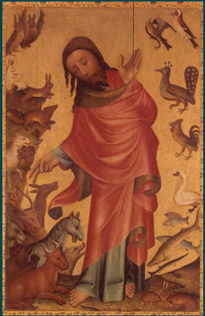
אלוהים בורא את העולם: מימין, אלוהים בורא את בעלי החיים; משמאל, אלוהים בורא את חווה. מתוך תמונת "מזבח גראבוב" (Grabow Altar) בכנסיית סט. פטרי בהמבורג, מאת מייסטר ברטרם (Meister Bertram), 1383-1379.